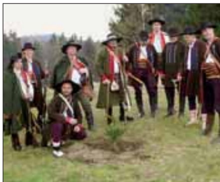
Vysazení portášské jedle na Klapinově