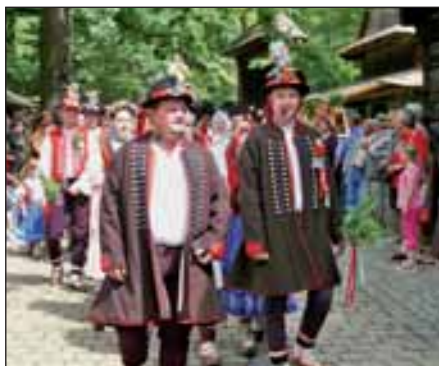
Rusavská svatba v Rožnově pod Radhoštěm