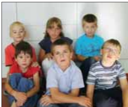
Naši malí prvňáčci