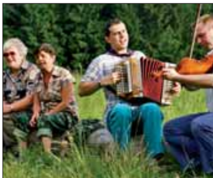
Svatojánský oheň vzplál i na Rusavě