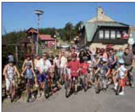
Aktivní klub na profi koloběžkách