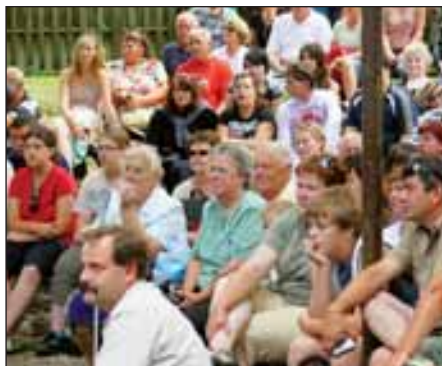
Putování po Valašsku – Rožnov pod Radhoštěm