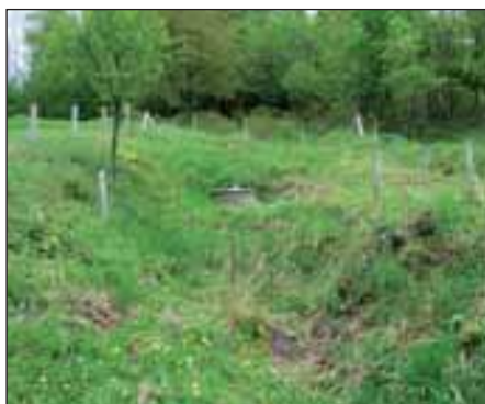
Pokus o dolování manganu na Rusavě – zavalená šachta